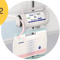
排尿計測記録システム「ウロチェッカー」 掲載画像出典:インダメディカル株式会社